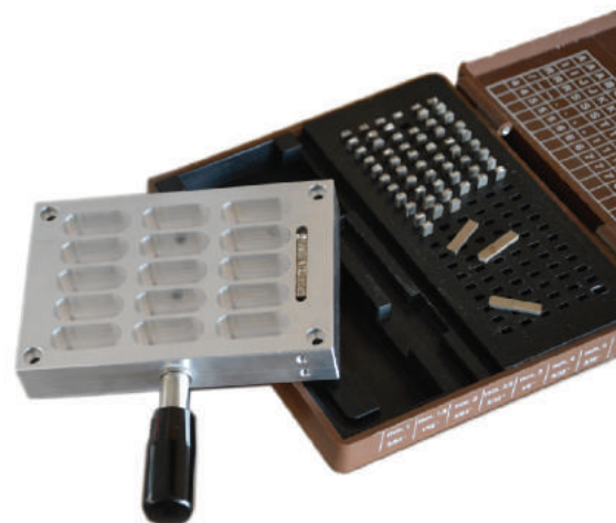
Caratteri lotto/scadenza disponibili Batch No/Expire date digits available