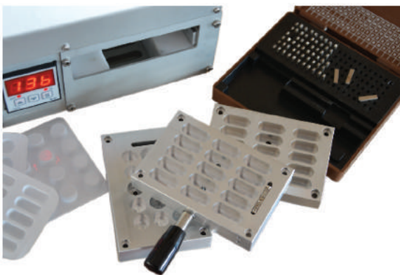
Stampi di diversi formati disponibili Moulds in different formats available