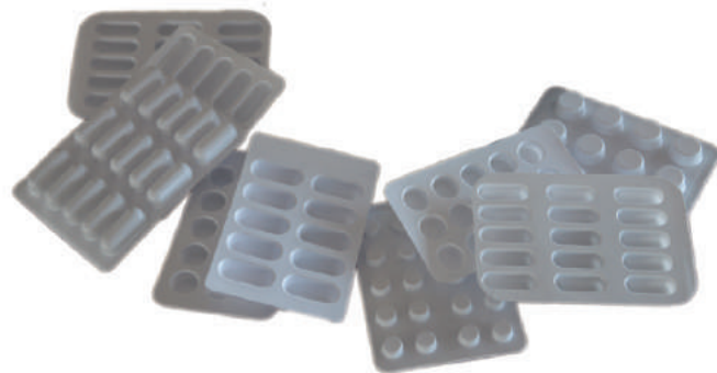
Blister di diversi formati disponibili Blisters in different formats available