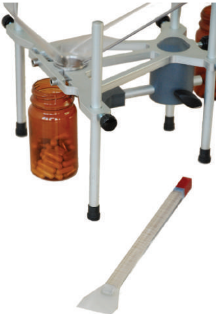
Base regolabile in alluminio disponibile Adjustable aluminium base available

Der kapselweise CM1 verscheidet sich für die abwesenheit der wartung. Es ist eine ausstattung die ziemlich leicht und kompakt ist. Der regulier-base lauger bringt zum ausgangs des kapselweise eines behalters. Die kanalen des abstieges orientieren mit leichter bewegung 10 kapseln direkt in der flasche oder in flakon. Beim entlassen des abaug's ladet sich die maschine wieder auf und fängt wieder mit der rechnung an. Das wechseln des formats enthält man durch des wechseln 10 kanalgruppen in dem man auf zwei drehknöpfen handelt.